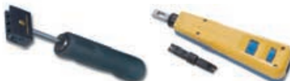
マルチベアインパクトツール